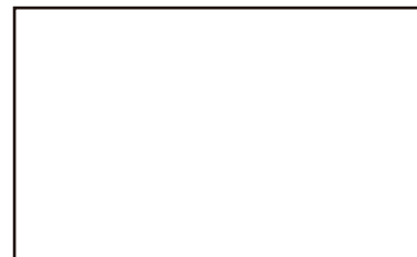
Carimbo do Revendedor

Mark Audio Indústria e Comércio de Aparelhos de Som LTDA. Fone: (43) 2102 0102 Rua Carlos Sartini Neto, 340 - CEP: 86800-760 - Apucarana - PR www.markaudio.com.br - markaudio@markaudio.com.br